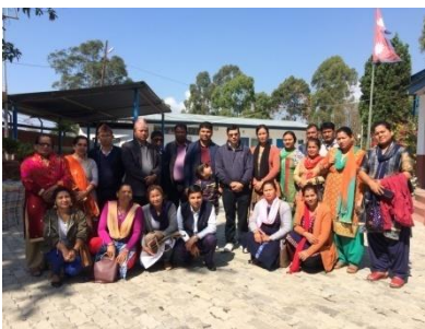
अध्ययन अवलोकनको क्रममा धनकुटा नगरपालिकामा पाल्नु हुने विभिन्न नगरपालिका र शिक्षण संस्थाका महानुभावहरू