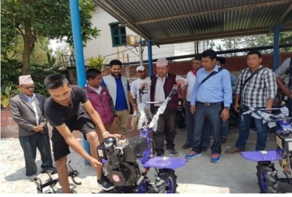
कृषकहरूलाई साभेदारीमा हाते ट्रयाक्टर वितरण गर्नुहुँदै नगर प्रमुख