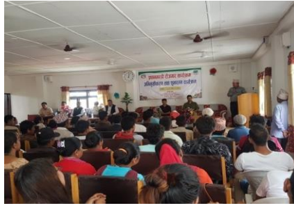
प्रधानमन्त्री रोजगार कार्यक्रमको अनुशिक्षण कार्यक्रममा