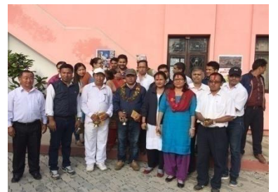
प्रदेश कार्यालयमा सुरुवा तथा घरेलु र कृषिबाट आउनु भएका कर्मचारीहरू (स्वागत एवम् विदाई)