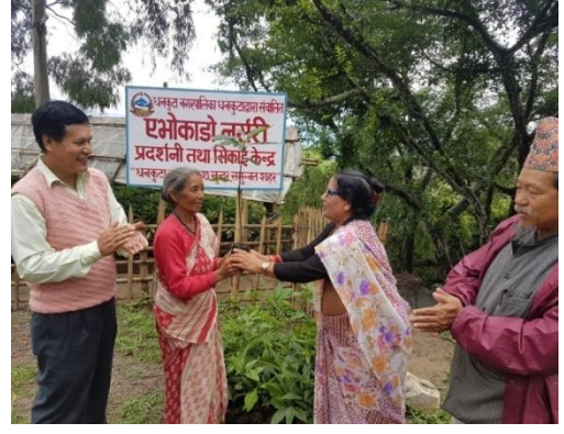
उपप्रमुखबाट एभोकाडोको बिरुवा वितरण गरिदै ।