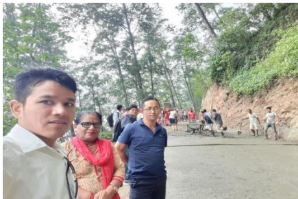
अनुगमनको क्रममा उपप्रमुख, प्रमुख प्रशासकीय अधिकृत तथा लेखा अधिकृत सहित टोलि