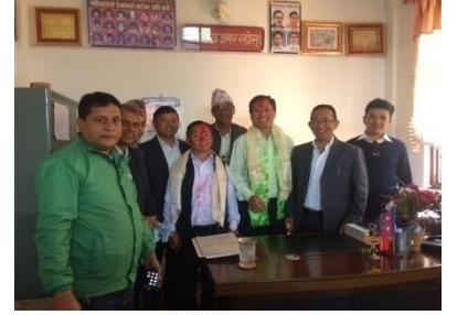
शिक्षा तथा मलेनिकाबाट समायोजन भई आउनु भएका कर्मचारीहरूको स्वागत