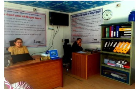
धनकुटा नगरपालिका र समृद्धि आयोजनाद्वारा सञ्चालित आप्रवासन स्रोत केन्द्र