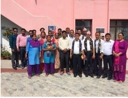
जि.स.स. र जिल्ला स्वास्थ्य कार्यालयबाट आउनु भएका कर्मचारीहरूको स्वागत