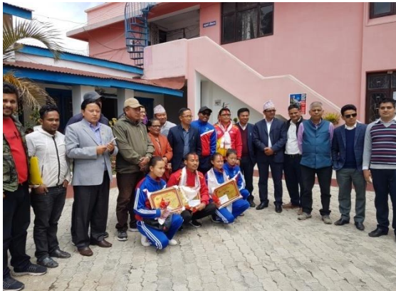
अन्तराष्ट्रियस्तरको तेक्वान्दो प्रतियोगितामा उत्कृष्ट भएका खेलाडीहरूलाईनगरपालिकाको तर्फबाट सम्मान तथा पुरस्कृत पश्चात ।