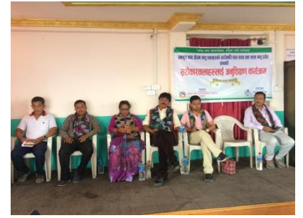
मासुको स्वच्छता र गुणस्तरीयता सम्बन्धी अभिमुखिकरण कार्यक्रम