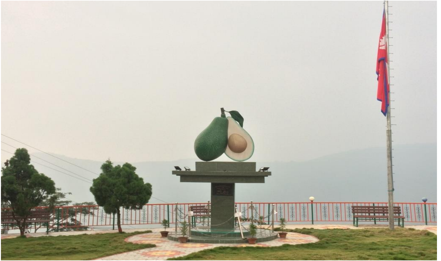
एभोकाडो पार्क (परिचय चौक)