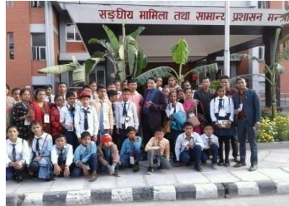
धनकुटा नगरपालिका वडा नं. ९ स्थित बालबालिकाहरूको अध्ययन भ्रमण