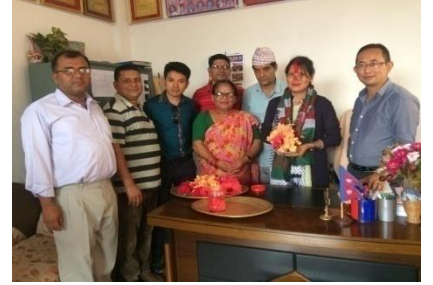
स्थानीय तहमा समायोजित कर्मचारीहरूको विदाई