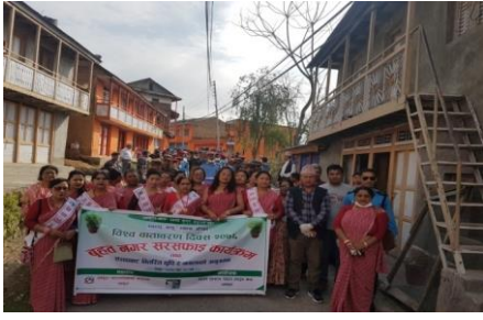
विश्व वातावरण दिवसको अवसरमा नगरमा सचेतना तथा सरसफाई कार्यक्रम ।