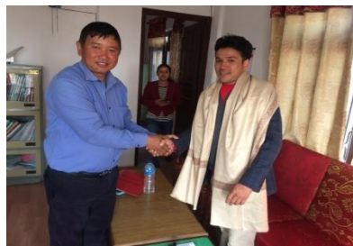
मलेनिकाबाट समायोजित कर्मचारीको स्वागत