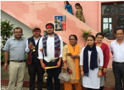
संघीय तथा स्थानीय सेवामा सुरुवा समायोजित कर्मचारीहरूको विदाई