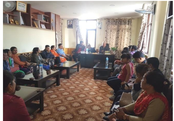
नगरवासीहरूको गुनासो सुनुवाई गर्नुहुँदै नगर प्रमुख ।