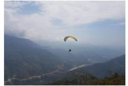
चुलीबनबाट प्याराग्लाइडिङको सफल परीक्षण उडान