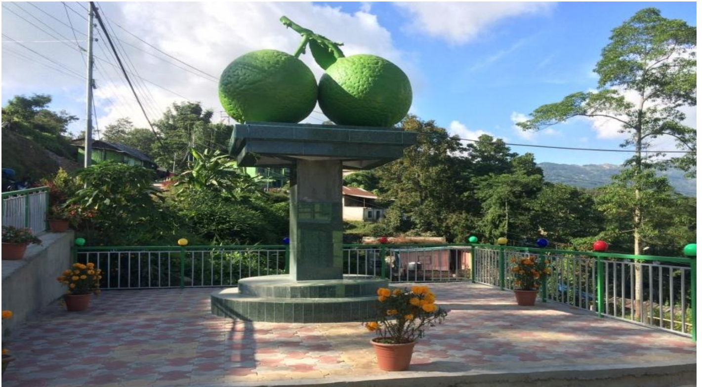
कागती स्तम्भ (कागते चौक)