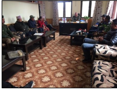
बजार क्षेत्रमा सवारी पाकिङ्ग सम्बन्धी सरोकारवालाबीच छलफल