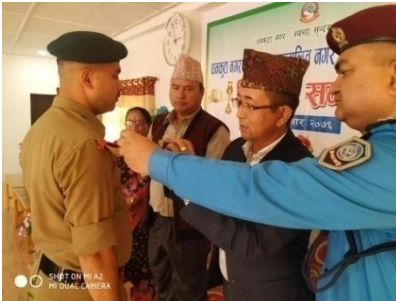
नगर प्रहरी तालिमको दिक्षान्त समारोहमा दर्ज्यानी चिन्ह प्रदान एवम् तालिम प्रमाणपत्र र पुरस्कार वितरण कार्यक्रम