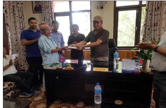
बाढीपहिरोबाट क्षति ब्यहोरेका १३० घरपरिवारलाई राहत रकम वितरण गर्नुहुँदै नगरप्रमुख ।