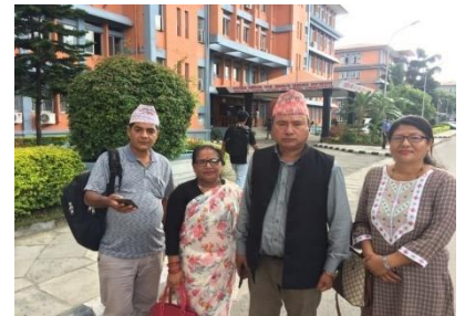
विशेष कार्यक्रम तथा बजेट मागका लागि विभिन्न मन्त्रालयको भ्रमण