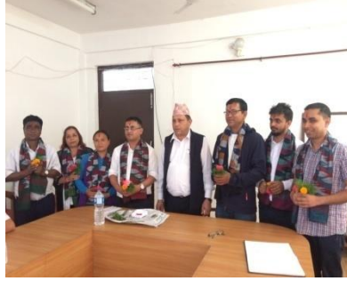
घरेलु, सरकारी वकिल तथा कृषिबाट आउनु भएका कर्मचारीहरूको स्वागत