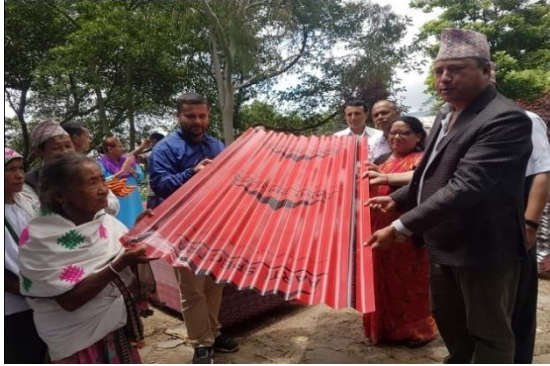
आवास सहूलियत साभेदारी कार्यक्रम मार्फत नगरका २५१ घरधुरीलाई जस्तापाता वितरण गर्नुहुँदै नगरप्रमुख, उपप्रमुख र प्रमुख प्रशासकीय अधिकृत