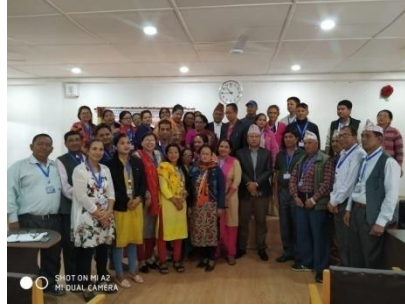
मेलमिलापकर्ताहरूको लागि क्षमता विकास तालिम एवम् मेलमिलाप प्रकृया