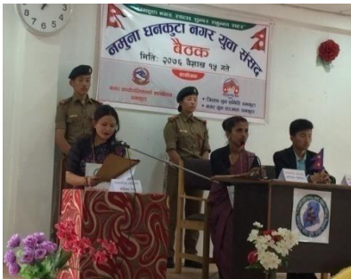
नमूना संसद तालिम